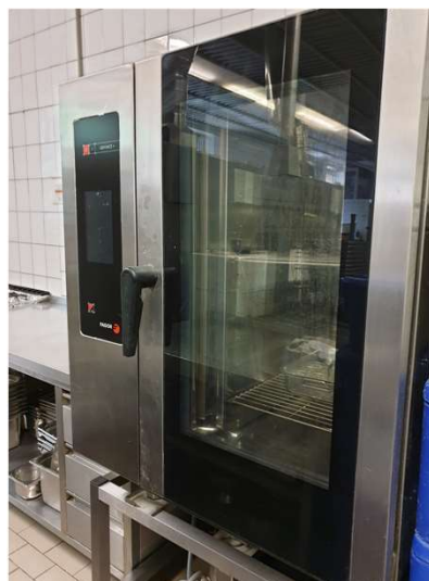
Nový elektrický konvektomat