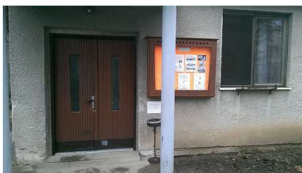
Staré okná a dvere